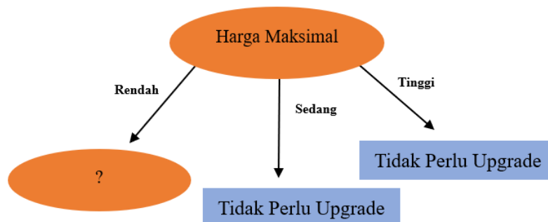
Gambar 1. Pohon Keputusan Node 1.1

Atribut harga maksimal memiliki tiga kategori nilai, dimana kategori Sedang diklasifikasikan sebagai “Tidak Perlu Update”, dan kategori Tinggi diklasifikasikan sebagai “Tidak Perlu Update”. Sementara itu, kategori Rendah masih perlu dilakukan perhitungan lagi karena belum mendapatkan kelas. Dengan demikian terbentuk pohon keputusan sebagai berikut: