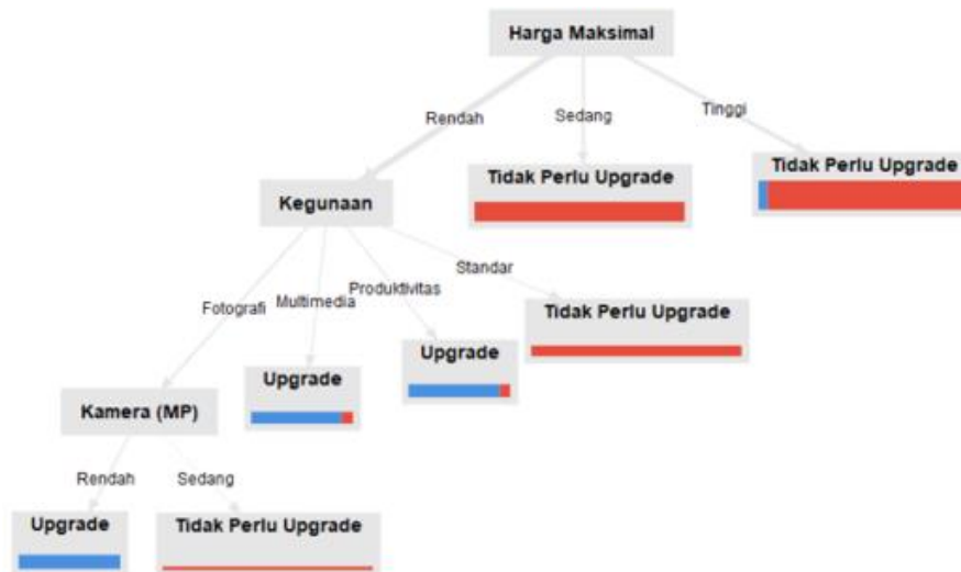
Gambar 2. Pohon Keputusan Node 1.3

Atribut RAM memiliki nilai gain yang lebih kecil sehingga tidak digunakan sebagai percabangan karena kontribusinya dalam membedakan kelas pada node ini lebih rendah dibandingkan dengan atribut kamera. Dengan demikian, bentuk akhir dari pohon keputusan dapat digambarkan sebagai berikut: